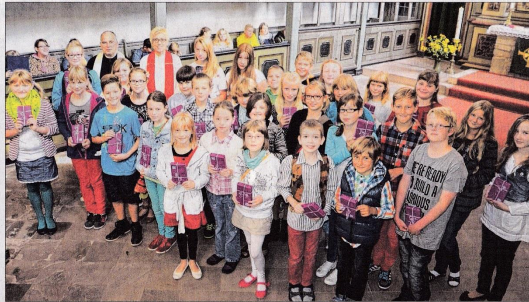
Mit den beiden neuen fünften Klassen zählt die Christliche Sekundarschule Gnadau insgesamt 130 Schülerinnen und Schüler, die an den Standorten Großmühlingen und Barby unterrichtet werden.